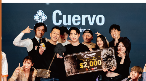
NLH Platinum Winner: Cuervo