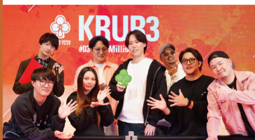
NLH Millions Winner: KRUR3