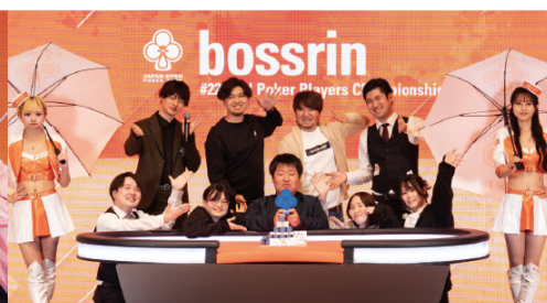
NLH Poker Players Championship Winner: bossrin