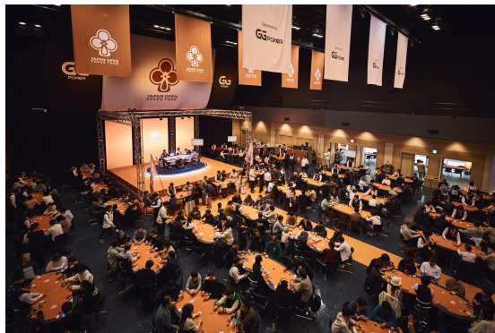
東京ポートシティ竹芝ポートホール